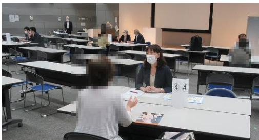
個別相談会：相談風景