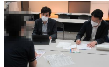
相談風景イメージ